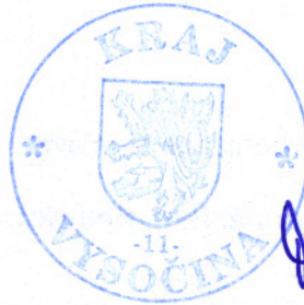
Miloš Vystrčil Miloš Vystrčil hejtman kraje